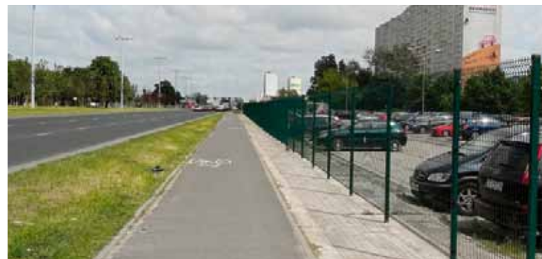
Miejsce na banery reklamowe

Zainteresowanych prosimy o kontakt z Panem Maciejem Leżuchem pod numerem tel. 56 648 67 84 wew. 241 lub mail: mlezuch@smnaskarpie.pl.