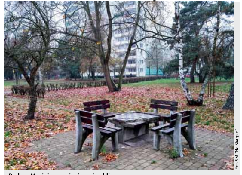
Park za Maciejem zmienia swoje oblicze

Pierwotna koncepcja została poddana w listopadzie dodatkowym konsultacjom, w które włączyła