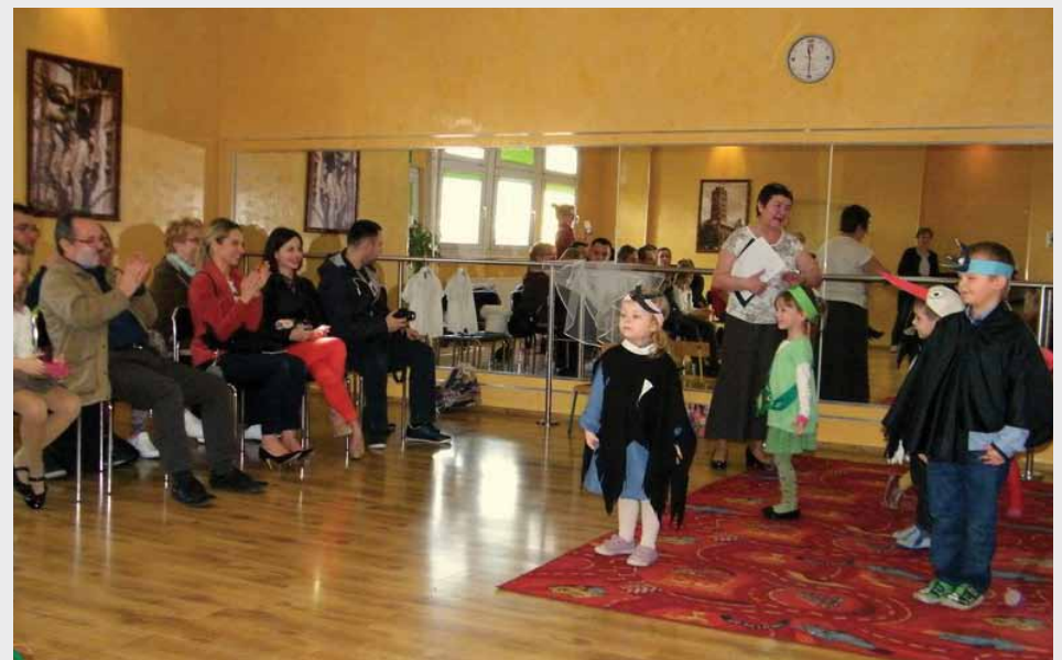
Zaproszeni goście gromko oklaskiwali swoje pociechy