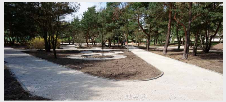
Rewitalizacja parku na nieruchomości Maciej przynosi coraz bardziej widoczne efekty