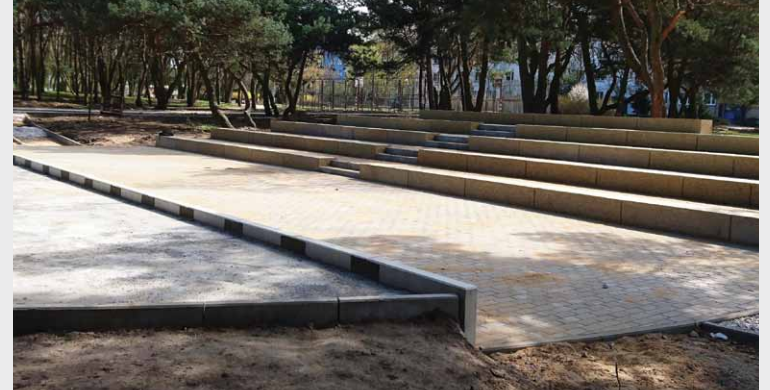
Park wzbogaci się, między innymi, o nową estradę