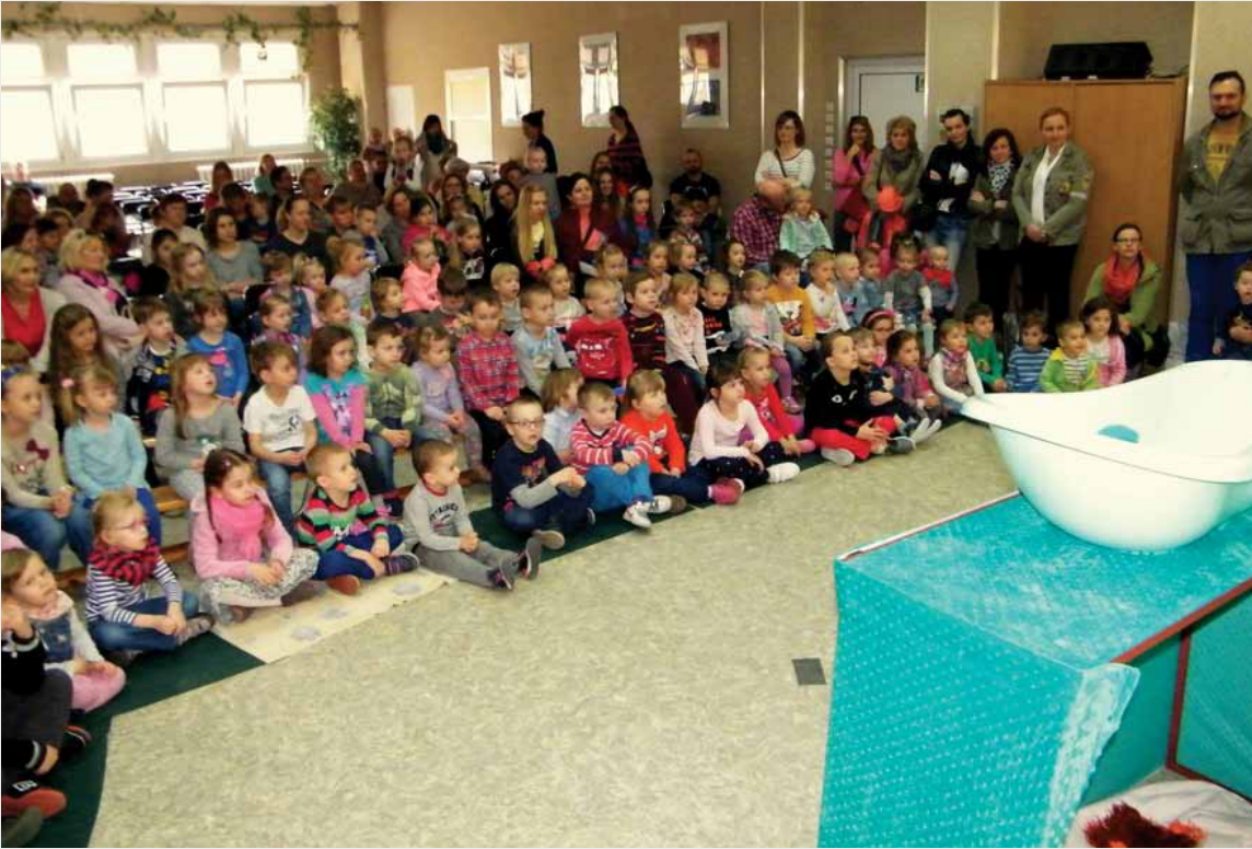
Przedstawienie pt. Świnka Chrumcia zgromadziło sporą widownię