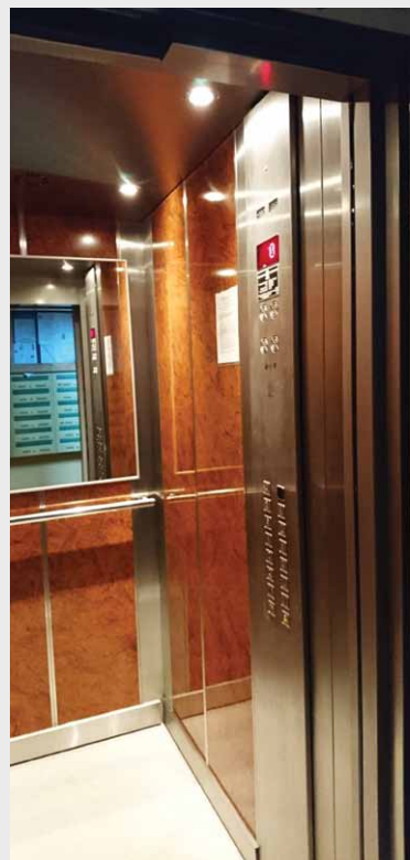
Dwie nowe windy zostały oddane do użytku w budynkach przy Sz. Lubickiej 174 oraz Ligi Polskiej 3 C