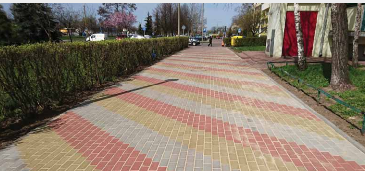
Nowa nawierzchnia chodnika - Ligi Polskiej 5