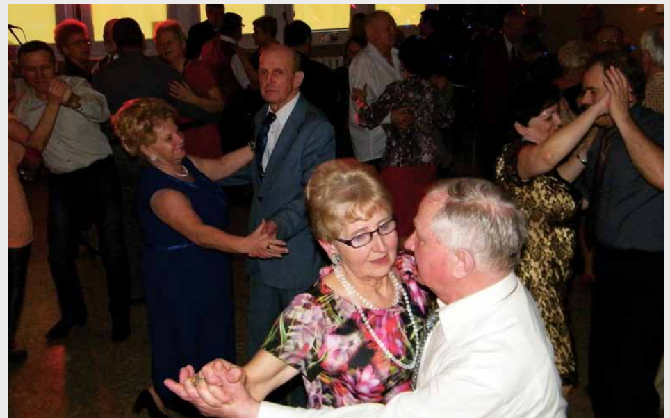
Atmosfera w Klubie Zodiak zawsze jest wspaniała