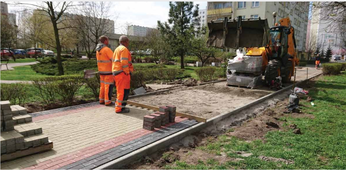
Układanie nowej nawierzchni chodnika - Szosa Lubicka 150