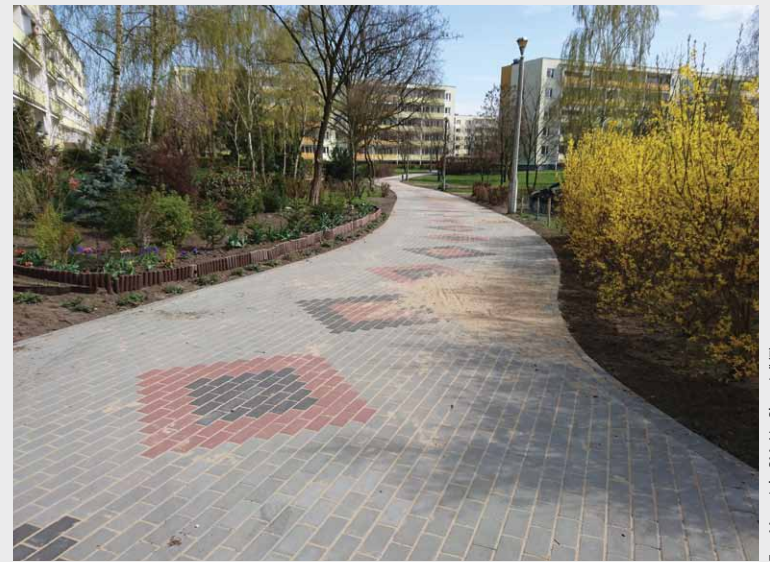
Odnowiona aleja przy Witosa 4 całkowicie zmieniła swój wygląd