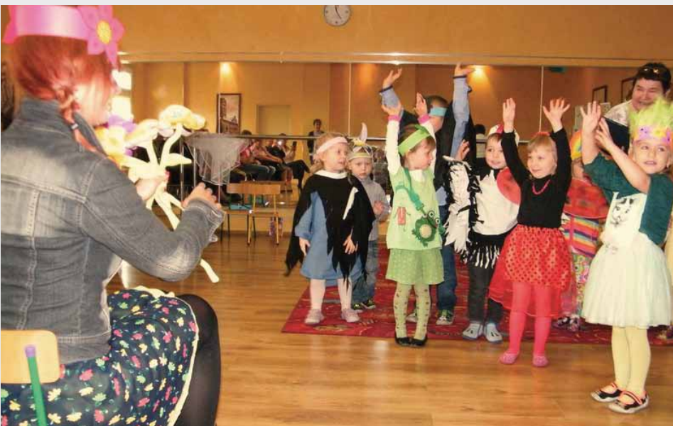
Montaż literacko-muzyczny Powitanie Wiosny w grupie przedszkolnej Mały Zodiacek