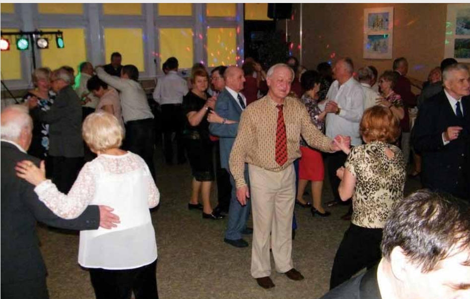
Zabawa dla osób 60+. Prima Aprilis - impreza nie na żarty ... ale na wesoło