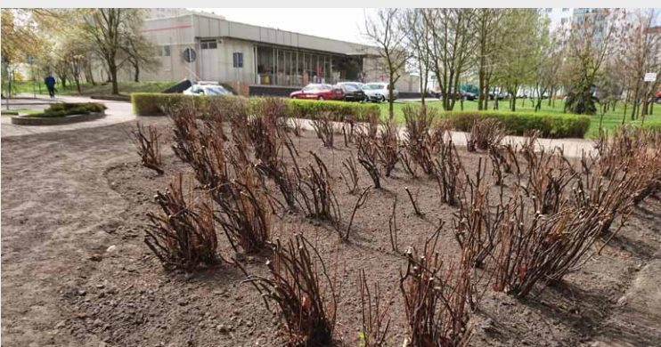
W ramach akcji rekultywacyjnej przeprowadzane są również cięcia sanitarno-pielęgnacyjne