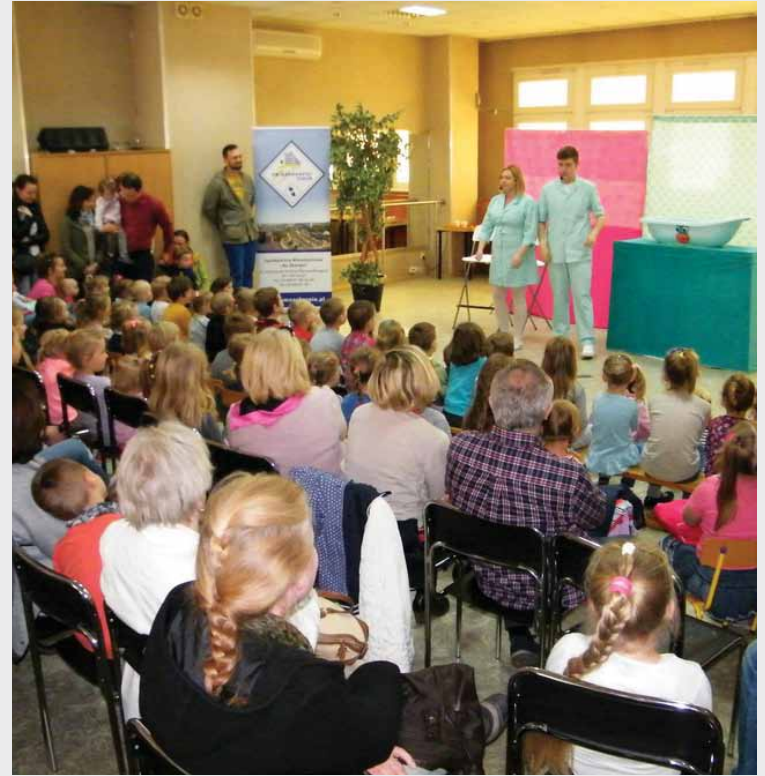
Spektakl miał edukacyjny charakter