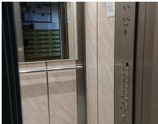
Nowa winda w budynku przy ulicy Suleckiego 2D. Od roku 2013 wymieniono już 60 wind ze 135 na całym osiedlu