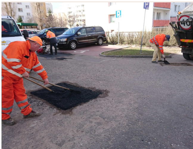
Mimo wielu obostrzeń naprawy nawierzchni realizowane są zgodnie z harmonogramem

Tak. Gospodarze w dalszym ciągu systematycznie dezynfekują domofony, przyciski w windach, poręcze oraz wszelkie klamki i uchwyty, czyli tzw. części wspólne co najmniej 2 razy dziennie, a oprócz tego nadal dbają o bieżący porządek i dostarczanie korespondencji. Przeprowadziliśmy również dodatkowe dezynfekcje klatek schodowych, wiatrołapów, piwnic poprzez specjalistyczną firmę, tak aby w maksymalnym stopniu dbać o bezpieczeństwo naszych mieszkańców w czasie pandemii. Jeśli będzie taka potrzeba w kolejnych okresach będziemy zlecać powtórne dezynfekcje. Od dnia 17.04 prowadzimy kolportaż maseczek ochronnych, które otrzymaliśmy z Urzędu Miasta Torunia. Maseczki są dostarczane do skrzynek pocztowych wg ilości osób zgłoszonych do spółdzielni. Są to maseczki wielorazowego użytku, które można prać nawet w temperaturze 60°C. Ich zadaniem jest oczywiście zwiększenie ochrony antybakteryjnej i przeciwwirusowej. Na ten moment otrzymaliśmy już dwie partie maseczek w ilości 8.000 szt. co stanowi około 40% ilości zarezerwowanej dla SM „Na Skarpie”. Darmowe maseczki otrzymali już mieszkańcy nieruchomości Jacek, Karolina i Maciej. Z informacji jakie zostały nam przekazane najbliższa do-