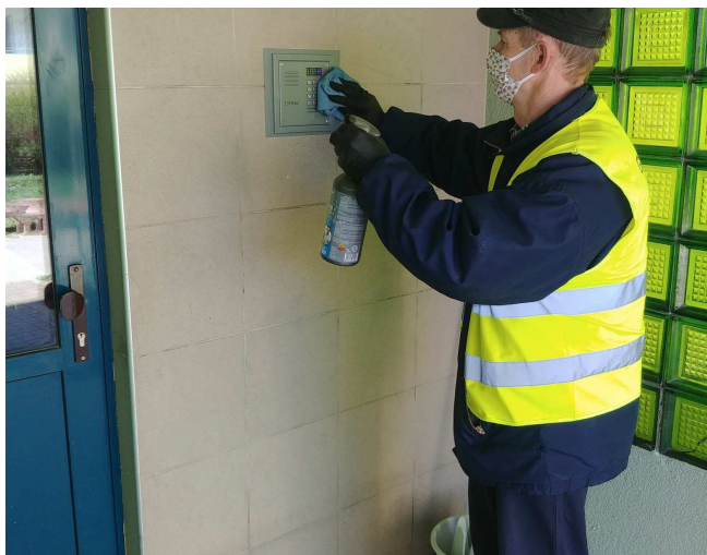
Gospodarze dezynfekują domofony, przyciski w windach, poręcze oraz wszelkie klamki i uchwyty co najmniej 2 razy dziennie