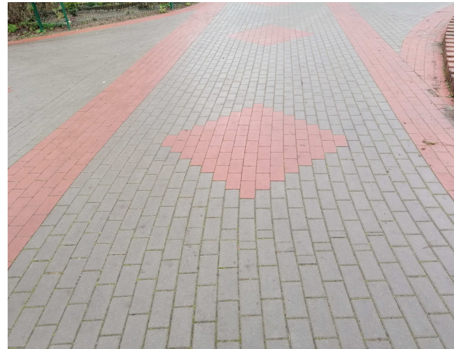
Wymiana nawierzchni chodników przeprowadzana jest obecnie w 19 lokalizacjach na całym osiedlu

Pierwotny termin Walnego planowany był w okresie od 30.03 - 03.04.2020 r. Niestety z przyczyn od nas niezależnych termin ten musiał zostać zmieniony.