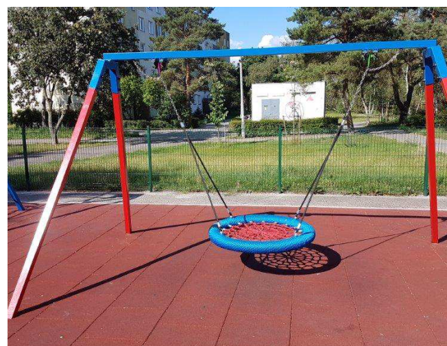
Nowe wyposażenie placu zabaw w nieruchomości Karolina. Modernizacja obejmuje też 7 innych placów zabaw na całym osiedlu

Mam nadzieję, że już niebawem będziemy mogli poinformować o nowym terminie, aby bezpiecznie spotkać się i przeprowadzić Walne Zgromadzenie.