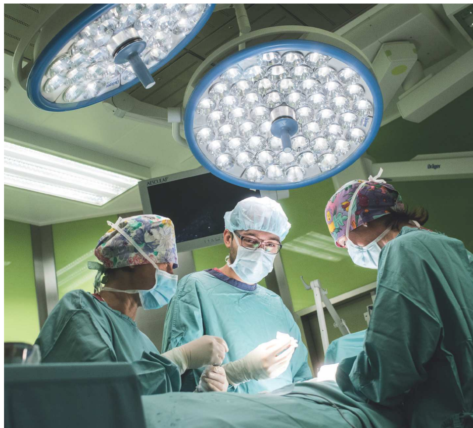
Publiczne szpitale w regionie otrzymają wsparcie w ramach specjalnego marszałkowskiego programu na zakup aparatury, środków ochronnych i dezynfekcyjnych.

Wśród planowanych zakupów m.in. 120 respiratorów, 12 ambulansów, aparatura do pozaustrojowego natleniania krwi, kardiomonitor, defibrylatory, aparaty RTG i USG, a także dedykowane systemy informatyczne. Te ostatnie to m.in. system do pracy zdalnej dla lekarzy radiologów, umożliwiający ocenę i opis materiału diagnostycznego poza szpitalem. Inne rozwiązanie teleinformatyczne pozwoli na zdalną komunikację głosową pacjentów z personelem pielęgniarskim. To narzędzie, wykorzystujące m.in. telefony komórkowe pacjentów i szpitalne wi-fi, wdrożymy na razie w Szpitalu Zakaźnym i Centrum Pulmonologii.