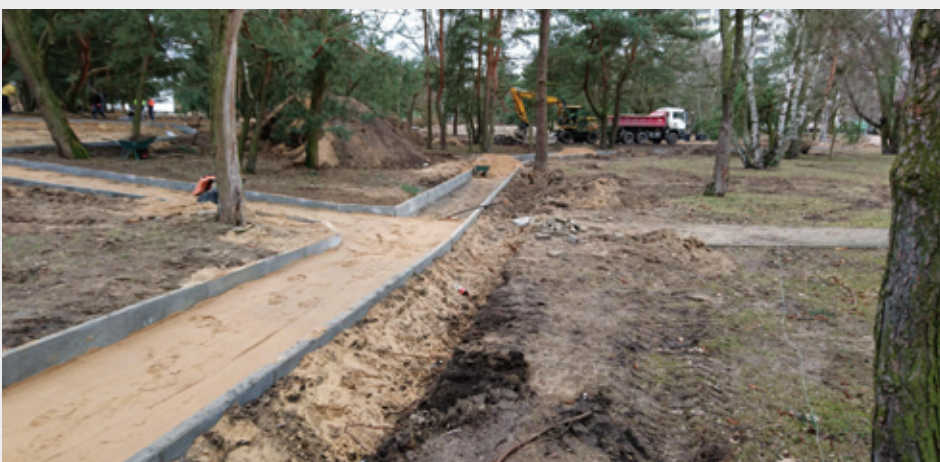
Prace przy rewitalizacji osiedlowego parku