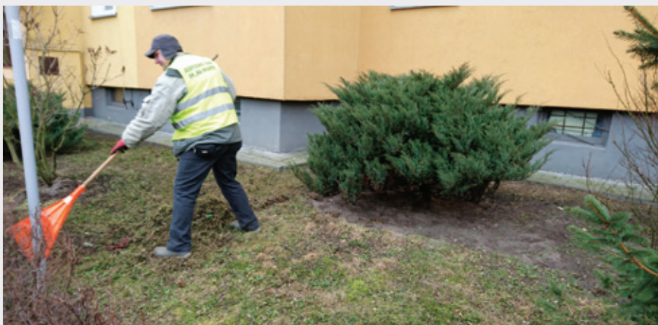
Obecnie grabione i czyszczone są oczka przydomowe