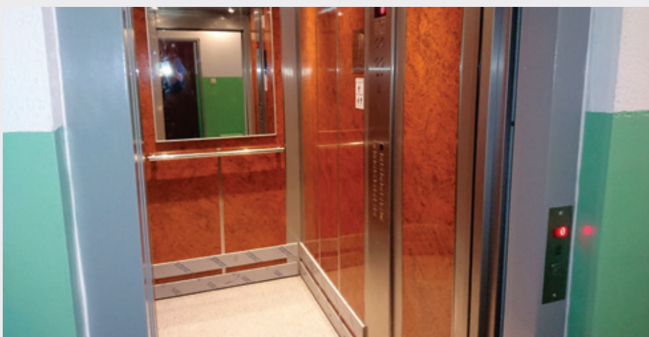
Kolejna nowa winda na osiedlu o udźwigu 1 tony - Kusocińskiego 12