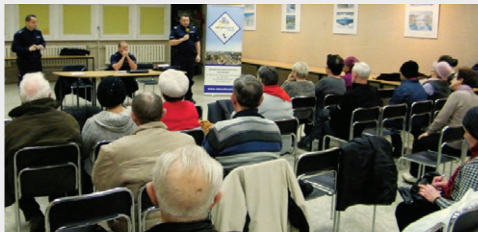
Klub ZODIAK - Spotkanie z dzielnicowym nt. „Nie daj się oszukać-powiedz NIE”