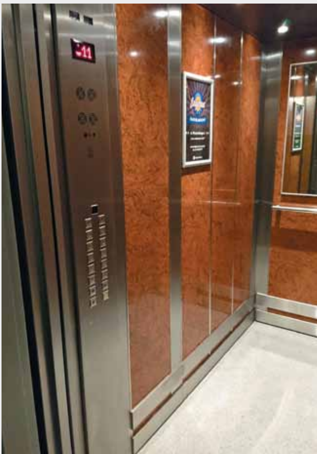
Nowa kabina windy przy ulicy Kusocińskiego 10