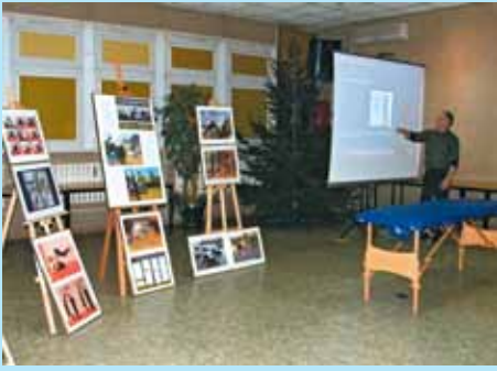
Spotkanie nt. edukacji zdrowotnej - Praktyczne metody profilaktyki schorzeń kręgosłupa odcinka szyjnego