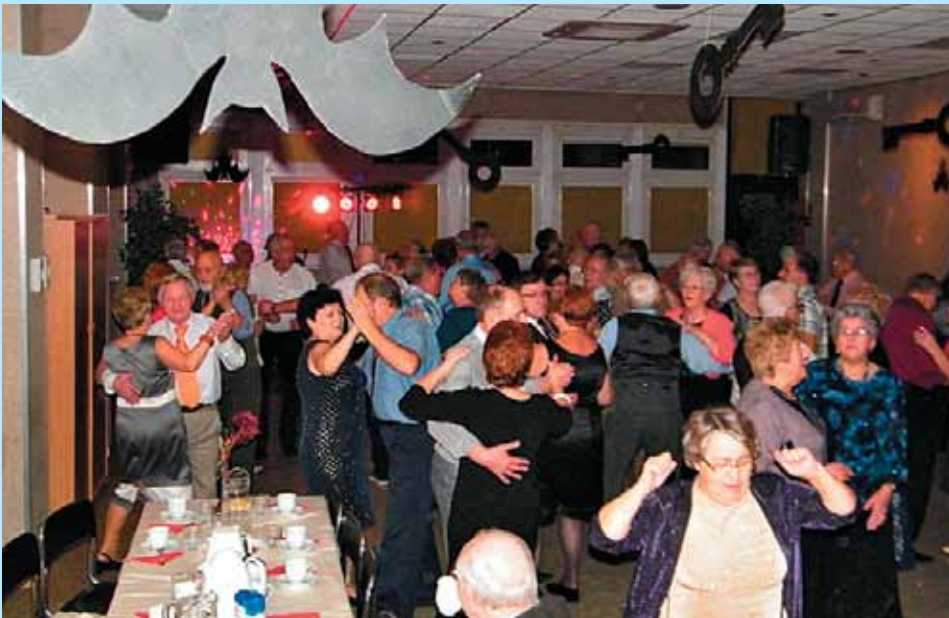
Wieczór Andrzejkowy dla osób w wieku 60+