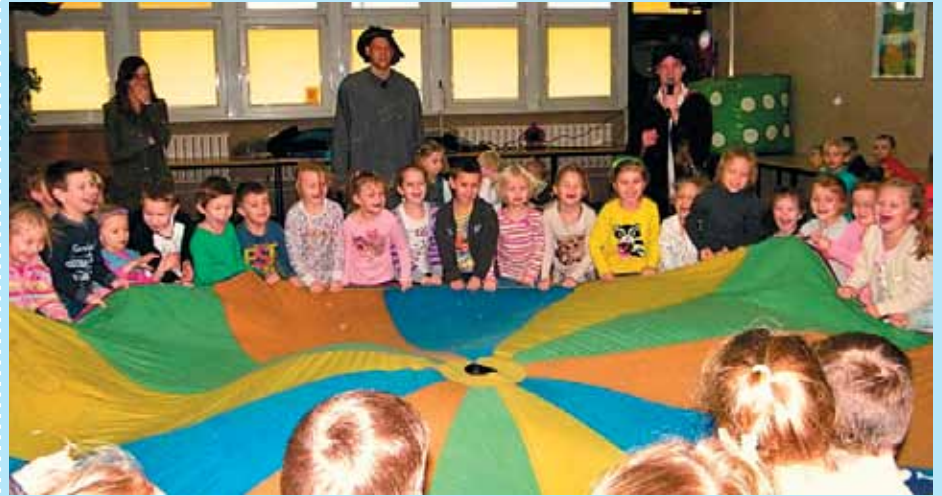
Andrzejki dla dzieci w wieku przedszkolnym ze Szkołą Magii i Czarodziejstwa oraz spotkanie z Harrym Potterem