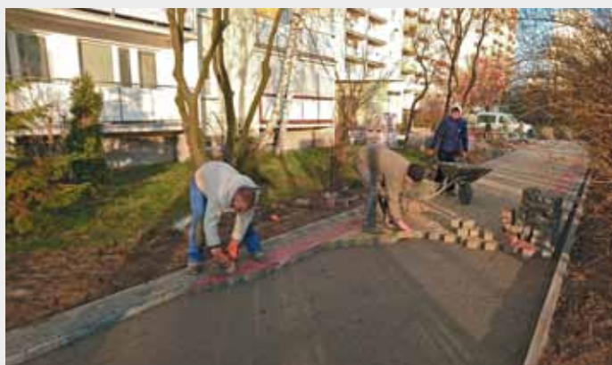
Przebudowa chodnika przy Szosie Lubickiej 154