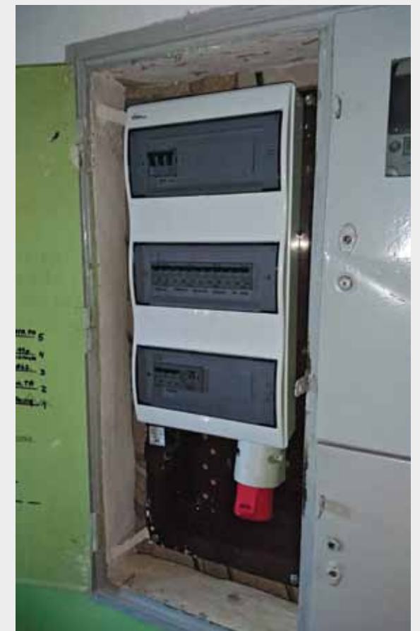
Rozdzielnia GTR po modernizacji. W ostatnim czasie zmodernizowano 7 takich rozdzielni na naszym osiedlu