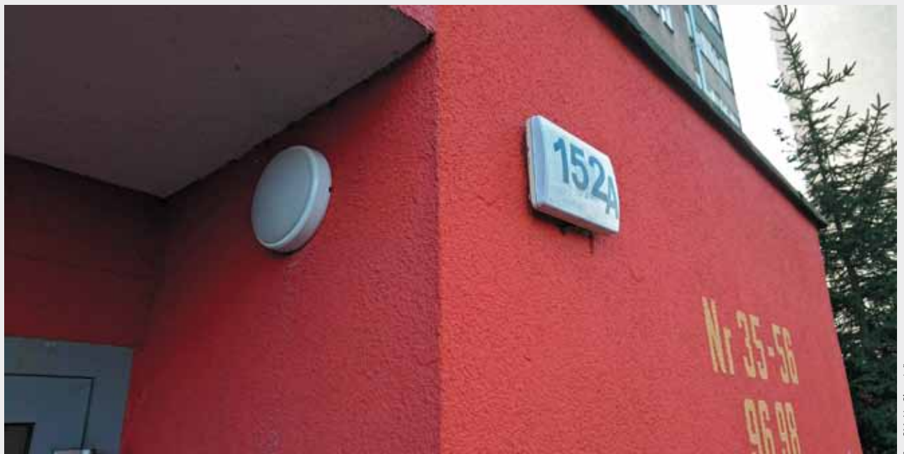
Nowe oświetlenie wewnętrzne oraz zewnętrzne wykonane w technologii LED zostało zamontowane w 6 budynkach przy Szosie Lubickiej