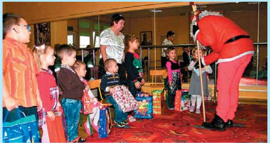
Mikołaj w grupie przedszkolnej Mały Zodiacek