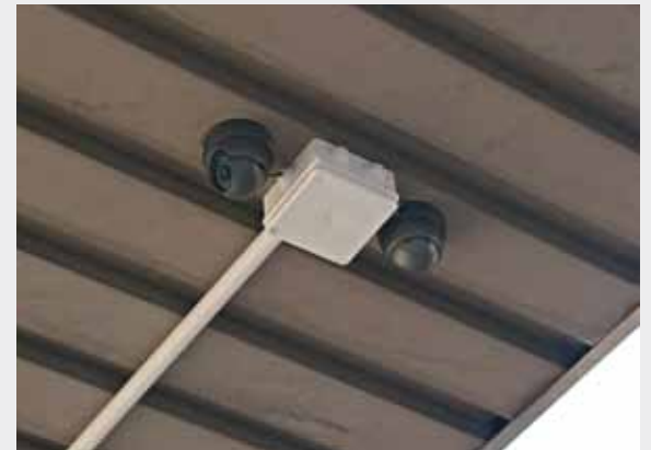
Na osiedlu zamontowano 9 nowych kamer monitoringu. Na wniosek mieszkańców pojawiły się one między innymi przy ul. Ligi Polskiej 3