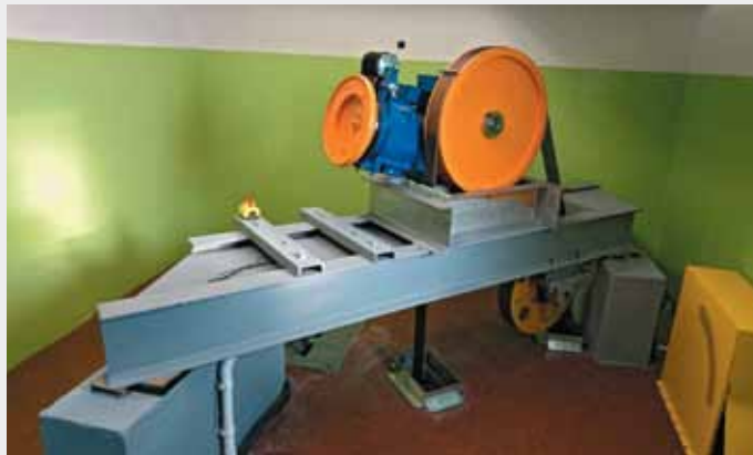
Zmodernizowana maszyna dźwigu przy ulicy Kusocińskiego 10 zużywa o 45 proc. mniej energii elektrycznej niż poprzednia

Zarząd Spółdzielni Mieszkaniowej „Na Skarpie” w Toruniu informuje, że z uwagi na dobrą sytuację finansową Spółdzielni i warunki kredytowe w dniu 15.12.2015r. dokonał przedterminowej spłaty części kredytu na termomodernizację w wysokości 1.098.798,61 zł. Więcej informacji na temat finansów spółdzielni w styczniowym wydaniu Widoku za Skarpę.