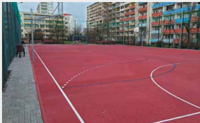
Nowo otwarte boisko przy Szosie Lubickiej 154 jest monitorowane