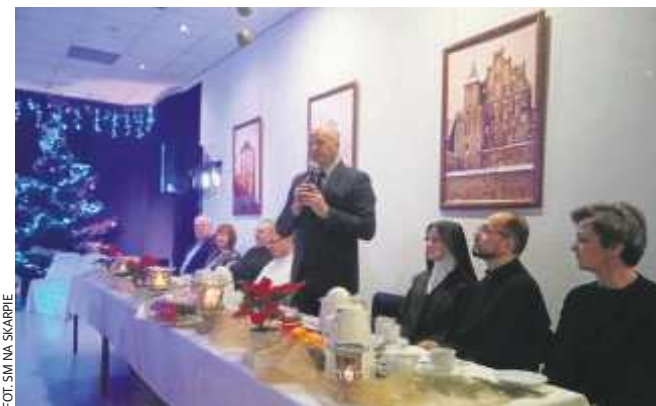
...dla osób w wieku 65+ z osiedla „Na Skarpie”