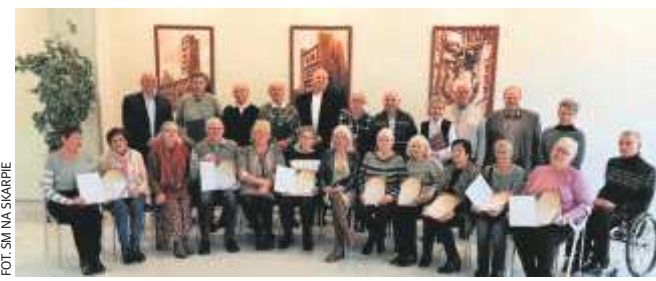
Laureaci konkursu wraz z Zarządem SM „Na Skarpie”