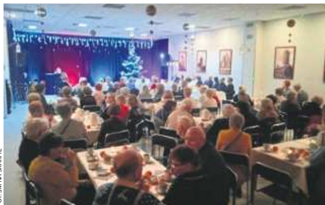
Liczne grono uczestników zgromadził wieczór kołęd...